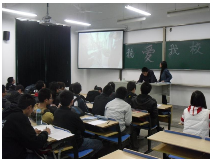
“我爱我校”主题班会