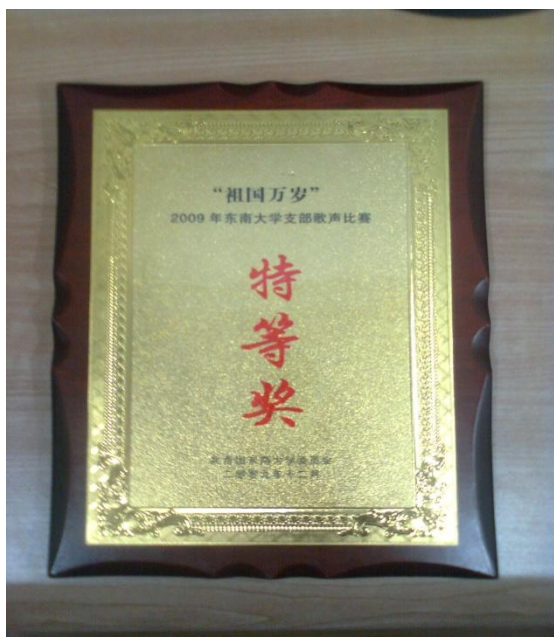
校级特等奖奖状，嘿嘿

支部歌声是贯穿了我们整个大一个的大型活动，从院系比赛到校级比赛，这个活动倾注了我们大量的汗水，从开始的陌生，一步步的走向默契，正是这个活动，让我们090092班凝结成了一个集体，大大加强了同学的归属感。院系第一，校级特等奖，让我们090092的每一位成员都感到自豪。真心希望，我们090092能够在接下来的日子里不断努力，不断进取，有更多的收获和快乐。